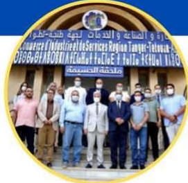
حاضنة المقاولات الحسيمة