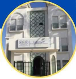
حاضنة المقاولات تطوان