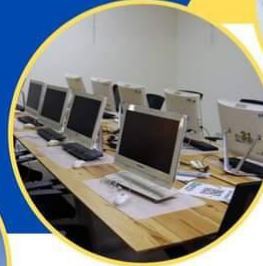
دار الإقتصاد الأخضر وزان