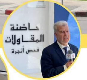
حاضنة المقاولات فحص أنجرة